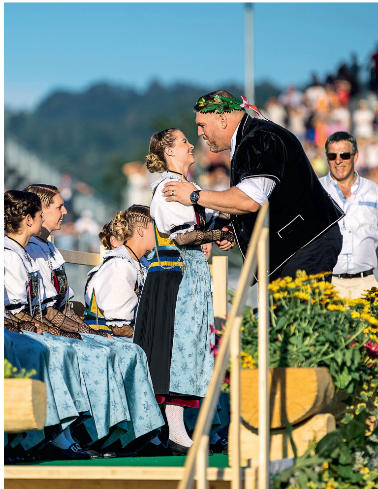
ESAF 2019 in Zug: Schwingerkönig Christian Stucki bei der Krönung.