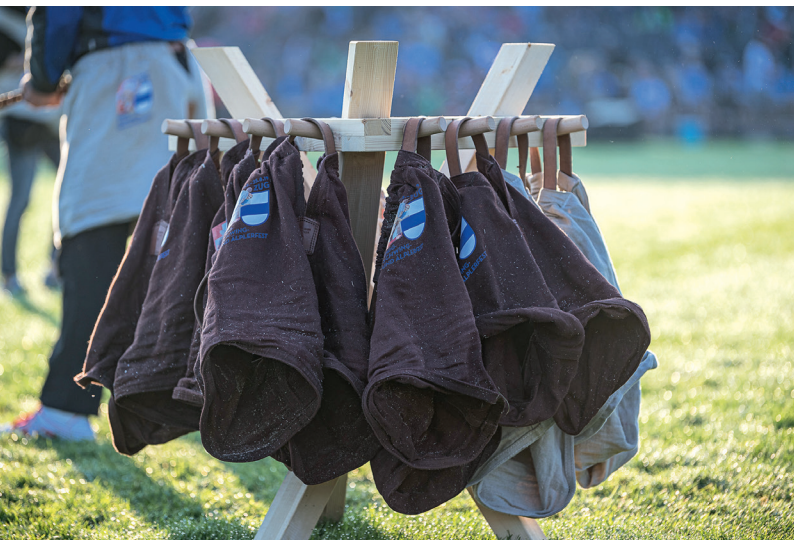
ESAF 2019 in Zug: Strapazierfähige Schwinghosen – ein wichtiges Utensil für kampfbetonte Duelle im Sägemehl.