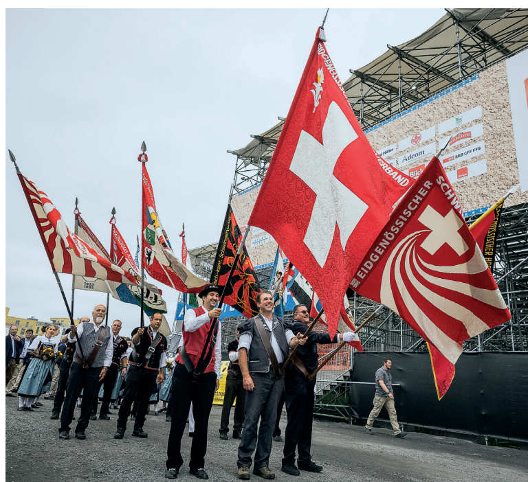
ESAF 2019 in Zug: Die ESV-Verbandsfahne – begleitet von befreundeten Verbands- und Vereinsbannern.