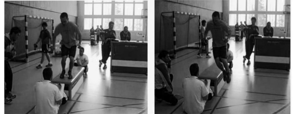
Abbildung 4: High Box Test vom Swiss Ski Powertest

Die Athleten springen während 90 Sekunden in seitlicher Position beidbeinig auf die High Box (2 obersten Kastenelemente), auf der anderen Seite runter und wieder dasselbe zurück. Die Füße sind immer parallel und in Längsrichtung orientiert. Die Anzahl Kastenberührungen während 90 Sekunden ergeben das Resultat.