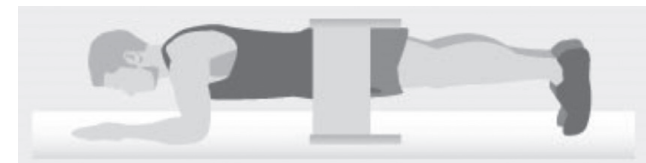
Abbildung 2: Ventraler Rumpfkrafttest aus dem Fitnesstest der Armee

Die erste Verwarnung erfolgt bei einem verlassen der geraden Position, oder beim Nichtbefolgen des Anheberhythmus. Bei einer zweiten Verwarnung wird der Test abgebrochen und die Zeit in Sekunden gestoppt.