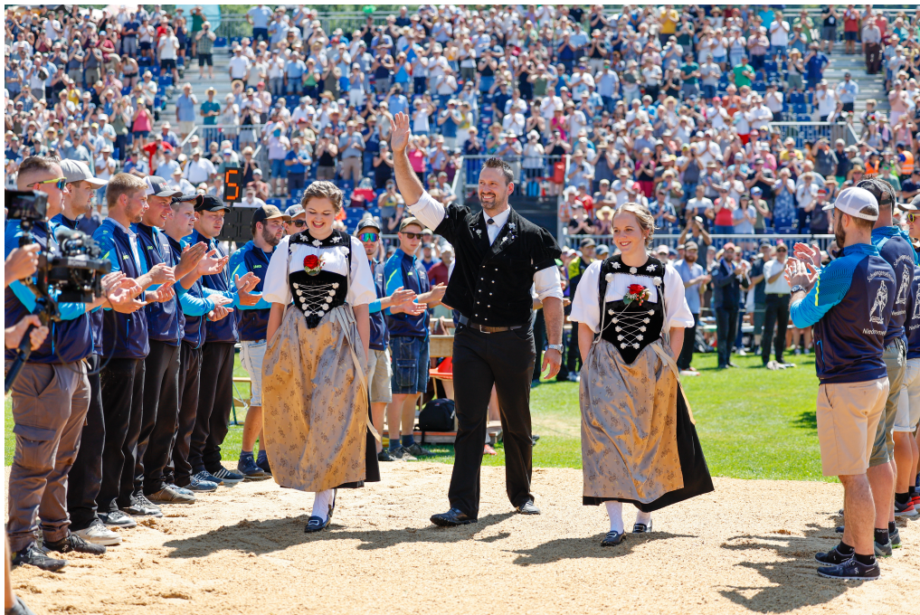
Schwingerkönig Kilian Wenger bei seiner Verabschiedung in Burgdorf

Kilian Wenger, einer der erfolgreichsten und bekanntesten Schwinger der Schweiz, gibt seinen sofortigen Rücktritt vom aktiven Schwingsport bekannt. Aufgrund wiederkehrender Rückenbeschwerden ist ein intensives Training und eine störungsfreie Vorbereitung auf die noch anstehenden Schwingfeste nicht mehr möglich. Mit seinem Rücktritt endet eine beeindruckende Karriere, die durch zahlreiche sportliche Erfolge und Spitzenleistungen geprägt war.