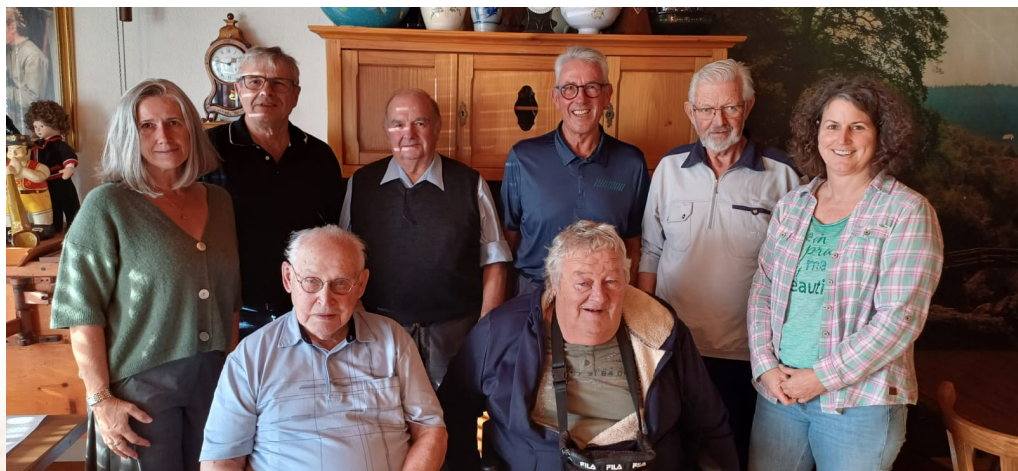
HV SSVV: Die Jubilaren zusammen mit der Obmannschaft