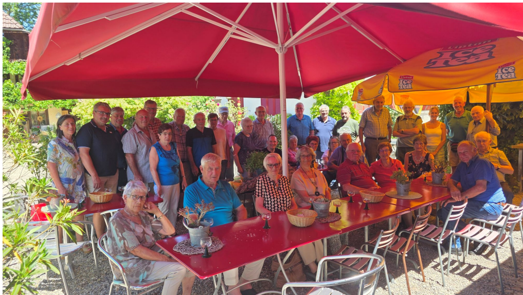
Alle Teilnehmerinnen und Teilnehmer auf einen Blick.