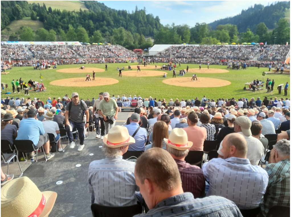
Arena Bernisch-Kantonales und Emmentalisches Schwingfest in Langnau i.E.