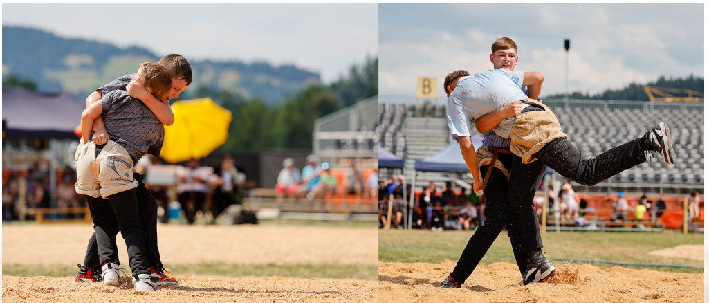
Emmentalischer Nachwuchsschwingertag in der gleichen Arena am 5.7.2025